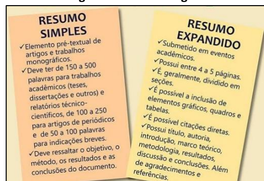
Figura 1: Título da figura